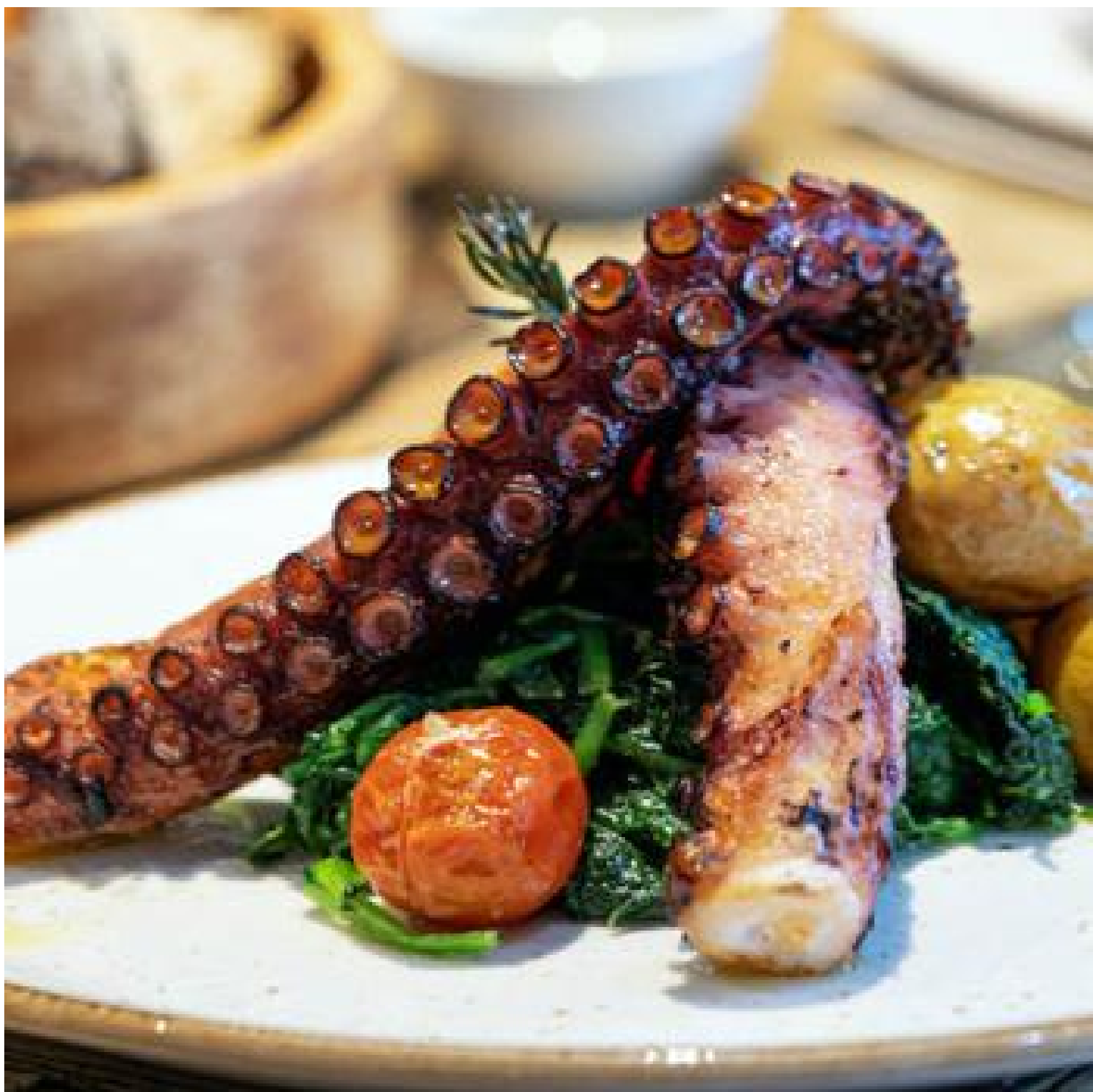
Pulpo al horno

Sin dejar a un lado esa calidad del producto y la tradición de la que hablamos, pero con un giro moderno e innovador, el restaurante Delfina Cantina Portuguesa (Praça do Município, 21) promete una cena inolvidable entre recetas de bacalao, sardinas, arroces, sopas, carnes y otros manjares. Ubicado en la planta baja del hotel Alma Lusa Baixa/ Chiado la carta de este restaurante es todo un ejemplo de platos caseros, honestos y de inspiración mediterránea. Infalibles su Bacalao “à Delfina” ,