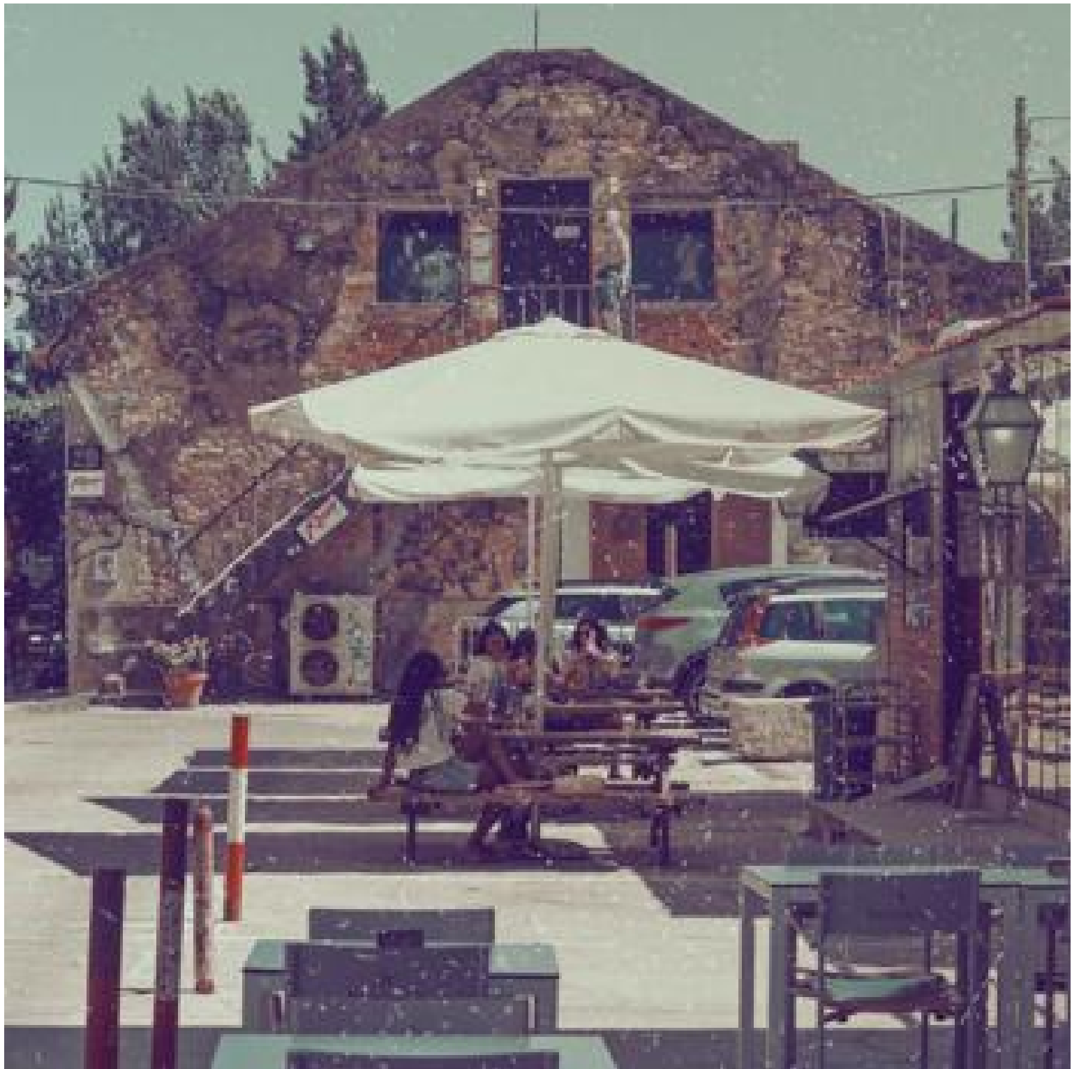
Uno de los espacios de LXFactory

Siguiendo con el arte local y la artesanía, a unos escasos siete minutos en coche desde el hotel y junto al famoso puente 25 de abril se encuentra LXFactory (R. Rodrigues de Faria 103), sin duda uno de los mercados más vanguardistas de la ciudad. Ubicado en una antigua área industrial recuperada , en sus calles de ladrillo conviven galerías de arte, librerías, tiendas de especialidades y profesionales creativos, además de diferentes ofertas gastronómicas y de ocio. Un plan alternativo