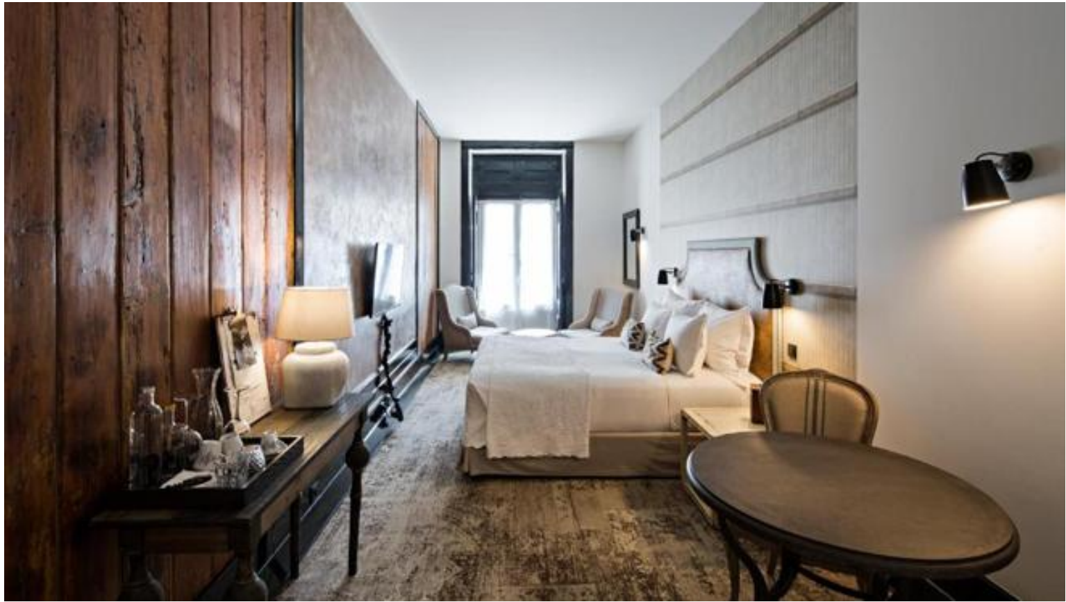
Una de las suites del hotel lisboeta - Alma Lusa Baixa / Chiado