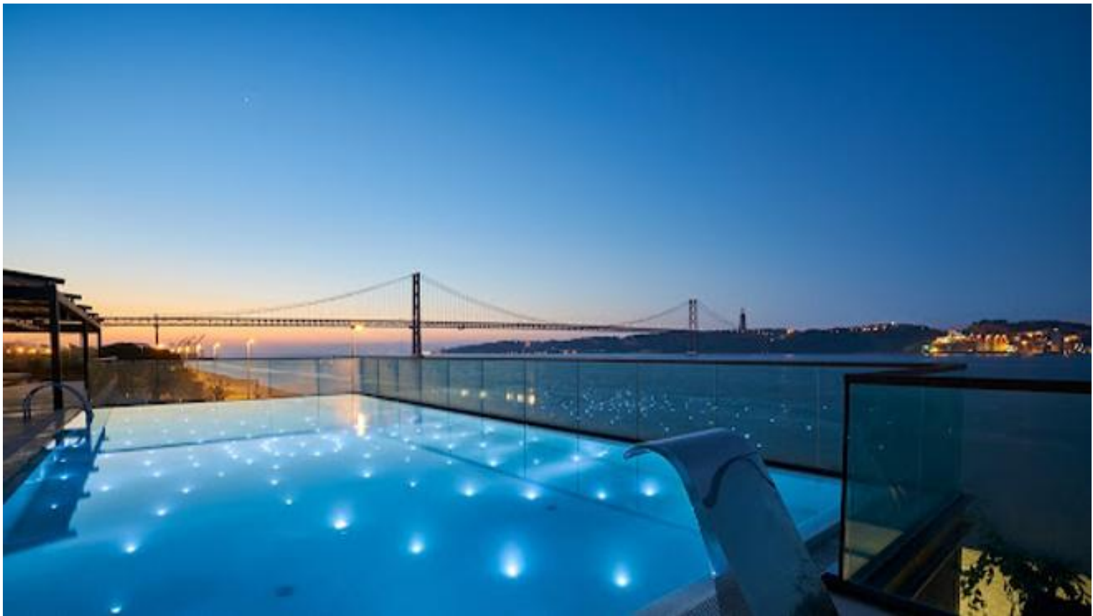
Vistas al Puente 25 de abril desde la zona de la piscina - SUD Lisboa

Y tras bajar de la embarcación nada mejor que seguir la jornada deleitándonos con otra perspectiva del Tajo y el emblemático puente. En esta ocasión desde uno de los clubs de moda más exclusivos de la ciudad. SUD Lisboa , inaugurado en 2017 en el barrio de Belem, es el primer proyecto de la cadena hotelera SANA, firmado por el reconocido arquitecto Antoine Pinto. Consta de diversos espacios en los que disfrutar desde de una jornada de piscina con el ambiente más relajado, hasta una comida gastronómica con esencia mediterránea en una de sus salas o un cóctel contemplando sus maravillosas vistas.