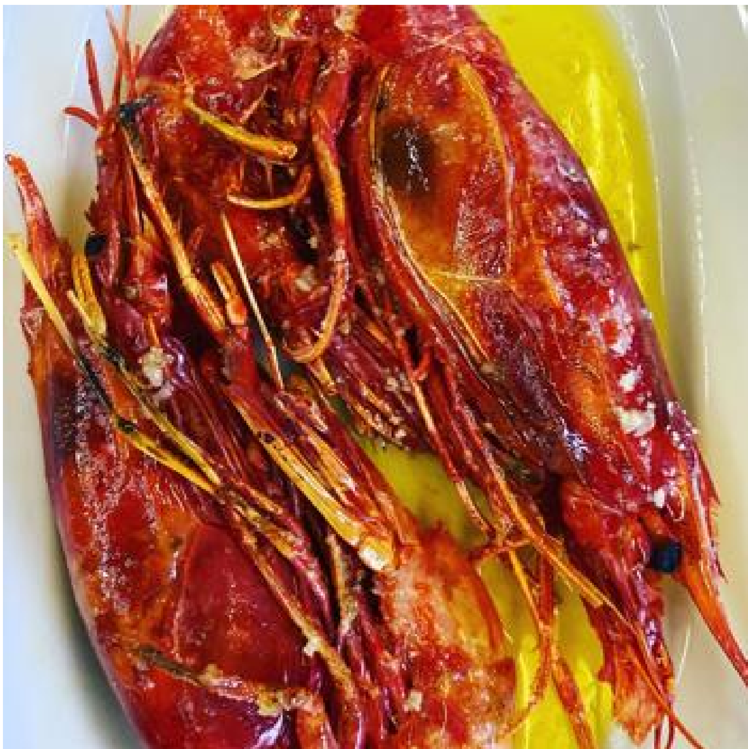
Carabineros en 'Cervejaria Ramiro'

Más allá del bacalao y las francesinhas , la gastronomía de Lisboa cuenta con una amplia variedad en la que el producto es siempre el gran protagonista. Y si de producto hablamos, los pescados y mariscos son los reyes de ' Cervejaria Ramiro ' (Avenida Almirante Reis, 1), todo un clásico en la capital que abrió sus puertas en 1956. De origen gallego, Ramiro sigue en manos de la misma familia, que a diario recibe a cientos de turistas y locales con una oferta sencilla de mariscos hervidos, a la