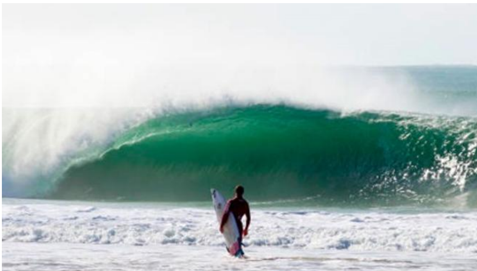
Surf en la Costa Caparica a 15 minutos de Lisboa

Lisboa también es una ciudad de playa. A penas a 15 minutos en coche desde el centro de la ciudad, cruzando el Puente 25 de abril, se encuentra la costa Caparica, la más cercana a Lisboa y la zona de recreo favorita para los lisboetas. Comienza al sur del Tajo, desde la propia localidad de Costa da Caparica y se extiende a lo largo de más de 30 kilómetros en forma de interminables playas de arena fina hasta llegar al Cabo Espichel , un hermoso mirador ubicado junto a un acantilado. Aunque la mayoría de las casas de pescadores de la zona fueron derruidas hace años, aún se aprecian algunos vestigios de una intensa actividad marítima. En ocasiones, los pescadores que aún salen a faenar por la zona exhiben, al caer la tarde, sus capturas sobre la arena.