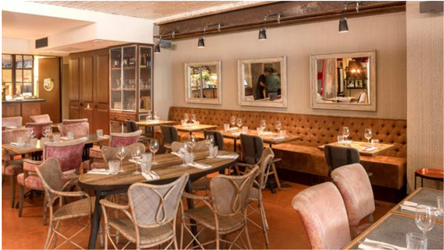
Uno de los espacios del restaurante Delfina Cantina Portuguesa - Alma Lusa