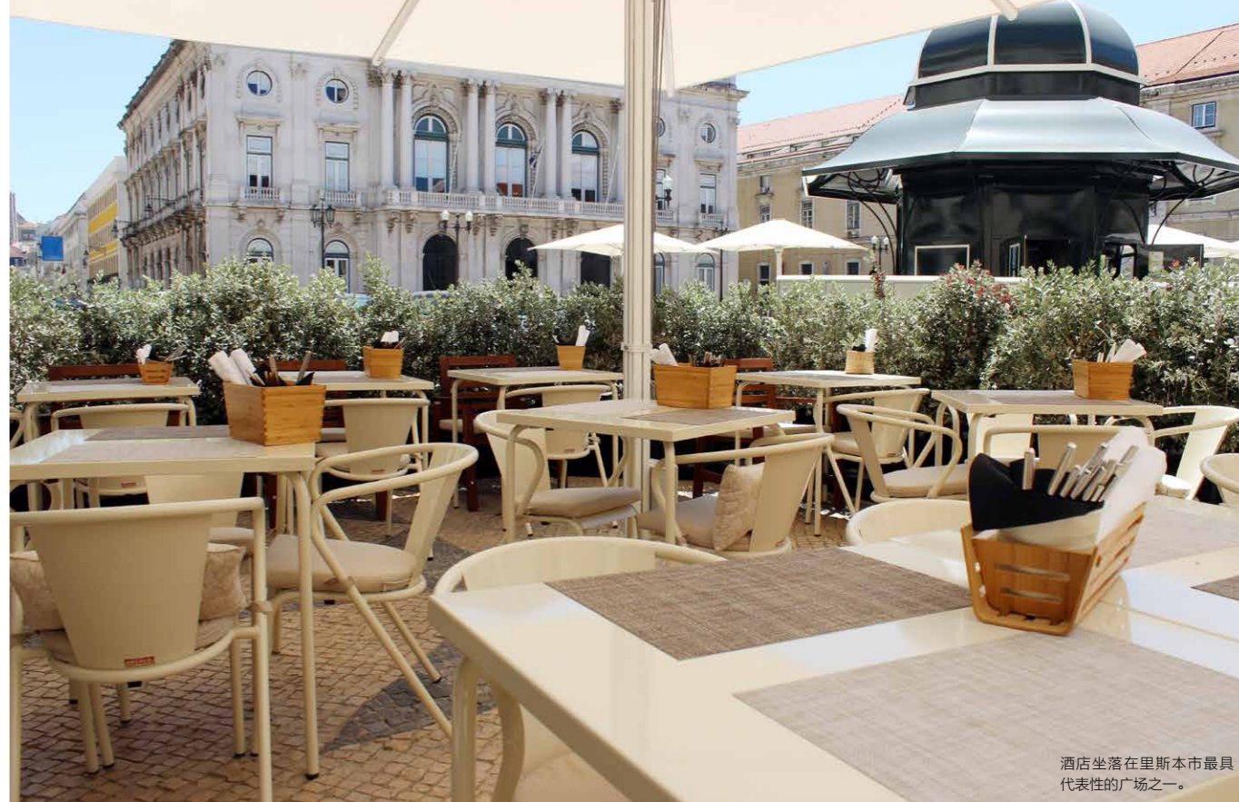
酒店坐落在里斯本市最具代表性的广场之一。